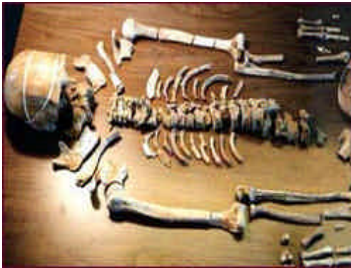
os de l'Homme de Kennewick

L'exemple le plus récent qui avait en fait causé une certaine clameur publique et médiatique en dépit du dogme de ce qui est politiquement correct, est le «quasi-rapatriement» du squelette caucasique complet de l'Homme de Kennewick vieux de 9500 ans. Une manœuvre légale de dernière minute a empêché que les os soient «décentement» enterrés selon les rites tribaux anciens dans un lieu secret connu seulement des aînés des Indiens de l'État de Washington. Les traits raciaux caucasiens embarrassants de l'Homme de Kennewick existent toujours pour rendre perplexe les anthropologues ou défier les mythes autochtones. Un compte-rendu très détaillé de l'épopée de l'Homme de Kennewick et ses implications peut être trouvé dans le livre Bones par Elaine Dewar. a